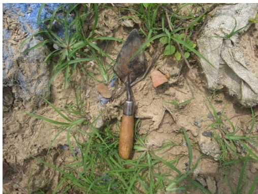
圖說：地表出土之細碎夾砂陶片