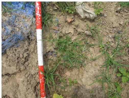
圖說：田埂邊可見細碎之夾砂陶片